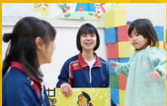
〈保育分野(女子のみ)〉H I